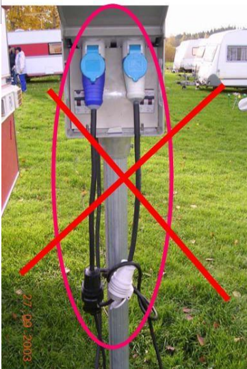
Sukojohdon liittäminen adapterilla ei ole sallittua.