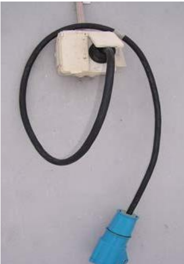
Adapteri, jolla liitäntäjohdon saa liittää sukupistorasiaan.